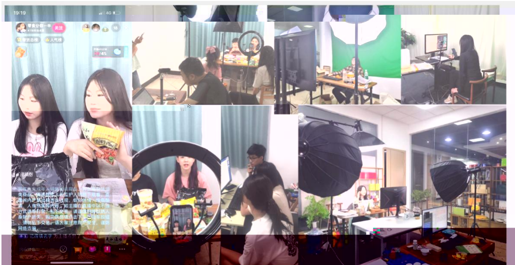
部份学员在进行电商直播实训现场